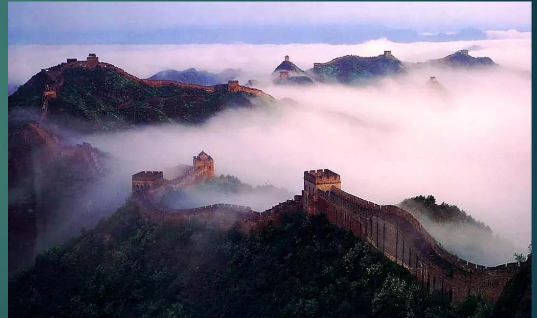
ΕΙΚΟΝΕΣ από το Σινικό Τείχος